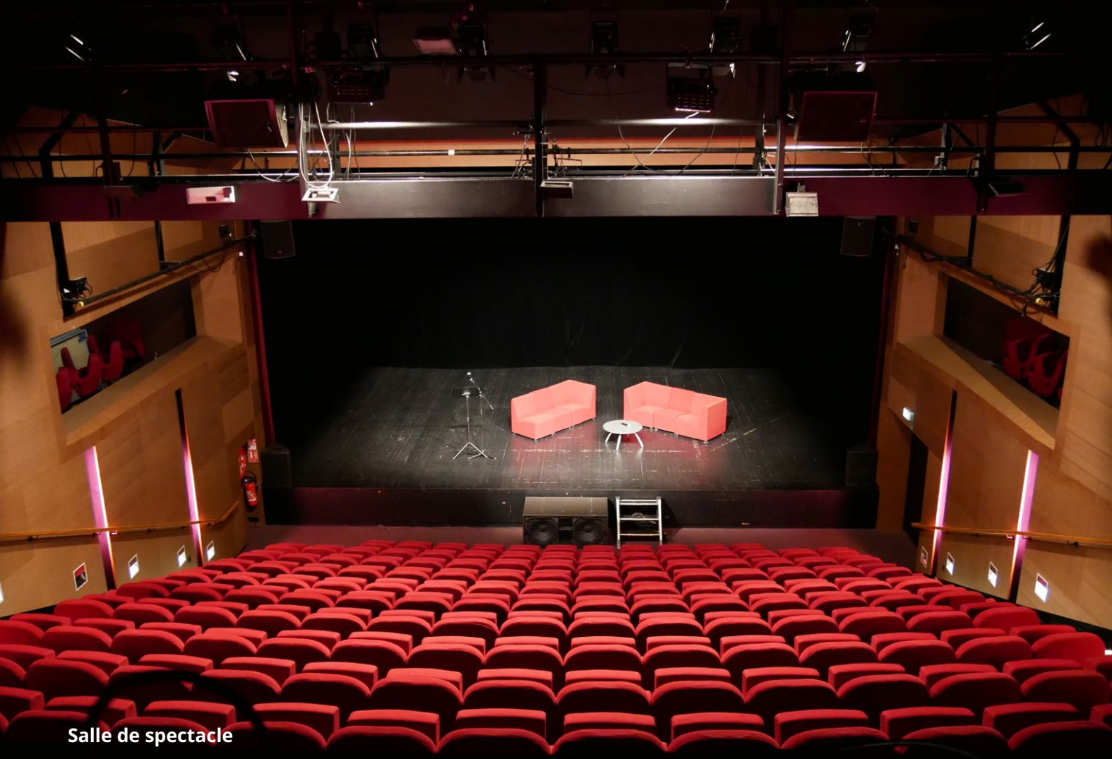
Salle de spectacle