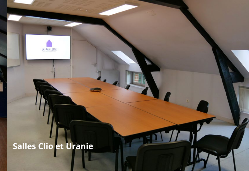
Salles Clio et Uranie