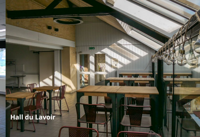
Hall du Lavoir